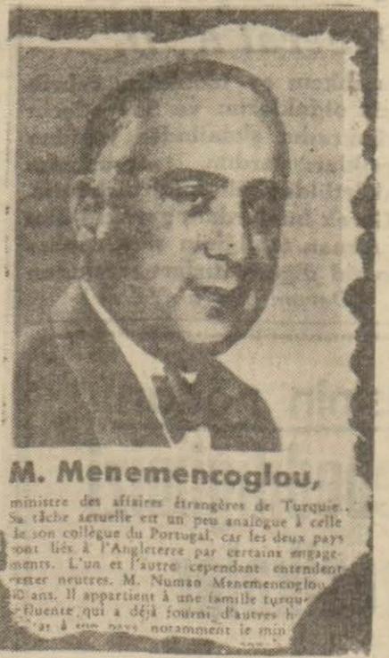
M. Menemencioğlu, ministre des affaires étrangères de Turquie. Sa tâche nouvelle est un peu analogue à celle de son collègue du Portugal, car les deux pays sont liés à l'Angleterre par certains engagements. L'un et l'autre dépendent entièrement de ses neutres. M. Numa Menemencioğlu dans. Il appartient à une famille turque. Il est à la tête d'une affaire importante.

Gördüğünüz resim Avrupalının en tanınmış bir mecmua-sında çıkmıştır. Adliye Vekilimiz Hasan Menemencioğlu'nun resmidir. Fakat mecmuadna Hariciye Vekilimiz olarak neşredilmiştir. Mecmuanın yaptığı bu yanlışlık birinci defa vâki olmamaktadır. Aynı resim Türkiye Hariciye Vekili diye aynı mecmuada bir defa daha basılmıştır. Avrupalının çok geniş imkân ve vasıtalarla malik bir mecmuasında dahi böyle yanlışlıklar olabileceğini göstermesi itibarile şayanı dikkat bir hâdise... Fakat son zamanlara kadar bayrağımızın resmini ters basan, Türkü şalvarlı ve yatağanlı olarak tasvir eden Avrupa basınıının iki vekilimizin resmini karıştırmak gibi bir hatasını niçin mazur görmemeli? Hattâ biz buna şükretmemiz lâzım gel-